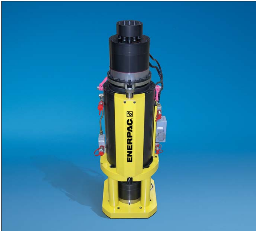
▼ 下图：TT-84SJ706型86吨钢绞线千斤顶