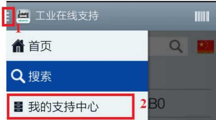
<图 3-1 进入我的支持中心>

“我的支持中心”是指在浏览产品的技术信息、手册等内容时可以通过前面提到的收藏按钮将该文献添加到自己的本地文件夹中。离线缓存这些文件信息方便客户在没有网络覆盖的情况下也可以随时查看这些文献内容。点击图 3-1 中的方框 1，选择“我的支持中心”。