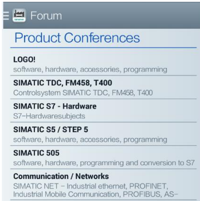
<图 4-3 论坛中的不同产品系列>