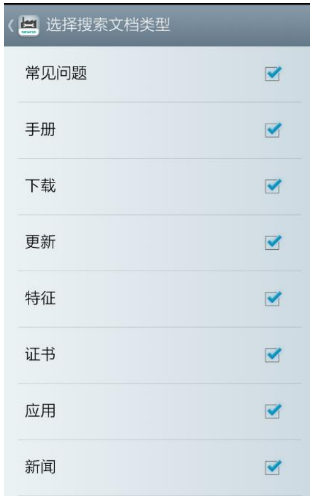
<图 2-13 订制文档类型>