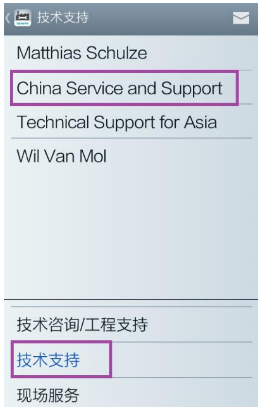
<图 2-10 技术支持>

屏幕上方选择中国技术支持与服务，进入到图 2-11 部分，可以看到中国区域的西门子技术支持与服务的具体联系方式。