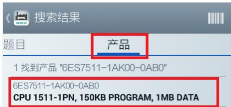
<图 2-4 产品信息 2>

若需要了解该产品的生命周期，即目前产品是否停产以及替代之类的信息可以进入到“产品”的标签栏进行查询。