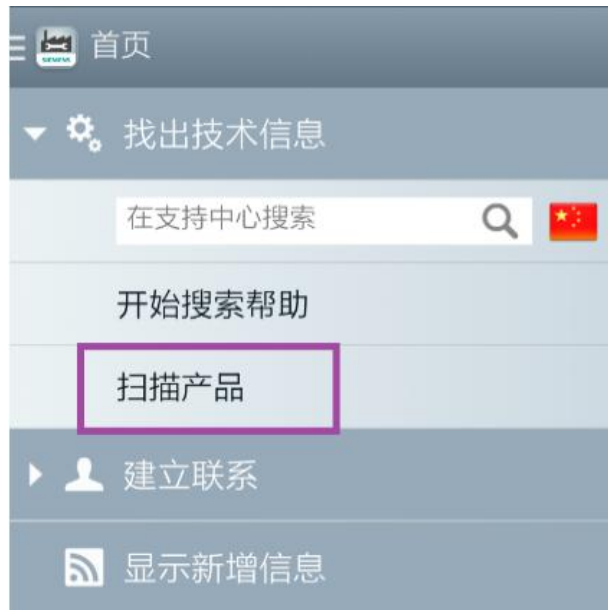
<图 2-7 扫描产品>