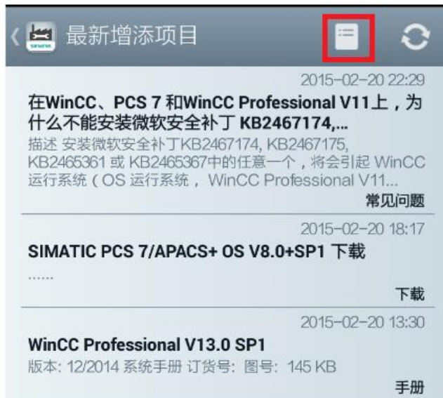
<图 2-12 显示新增信息>

“显示新增信息”关联西门子工业业务领域在线技术支持网站，会将常问问题、手册、软件及证书等信息及时更新。客户可以根据所关心的内容进行订制。点击图 2-12 中红色方框内的图标，进入到图 2-13，然后根据需要进行订制即可。