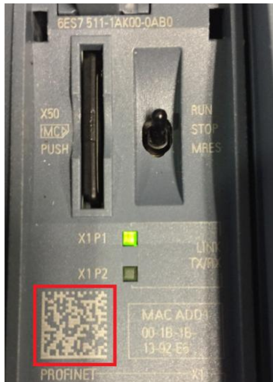
<图 2-8 S7-1500 产品二维码>

如图 2-8 所示。以 S7-1500 产品系列为例，可以在其产品端盖及端盖内部都能查找到红框内的二维码标识。然后通过“扫描产品”功能对准二维码区域进行扫描，就能直接进入图 2-4 的界面。可以说这个功能省掉了客户手动输入订货号的过程，比较方便快捷的查询到产品的技术信息。