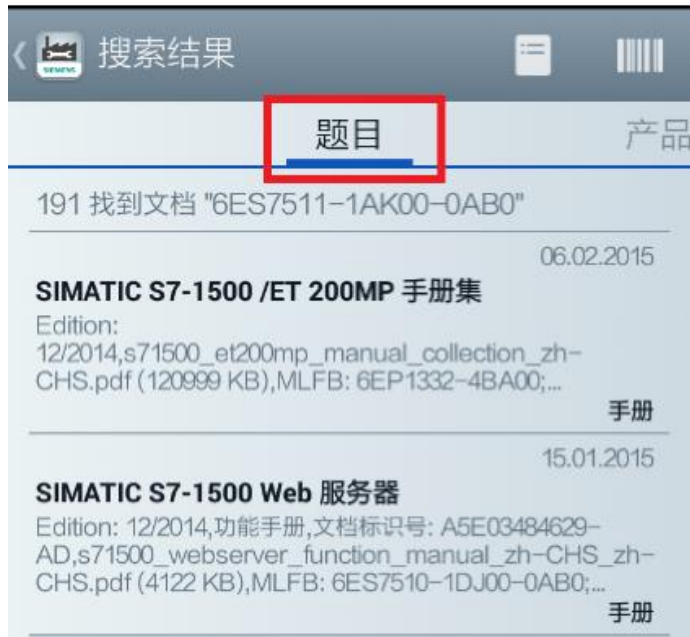
<图 2-3 产品信息 1>

输入 S7-1500 订货号点击确定后就能进入到“题目”标签栏，这里是与该产品相关的一些技术手册和常问问题。如图 2-3 所示。