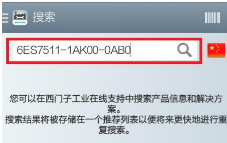
<图 2-2 搜索对话框>

“找出技术信息”的主要功能是查询产品的基本信息以及相关的手册、常问问题和证书等内容。“找出技术信息”有两种搜索方法：一、直接在搜索框中输入产品的订货号；二、通过扫描产品的二维码。下面先来看第一种搜索方法，以 S7-1500 产品系列为例，如图 2-2 所示。