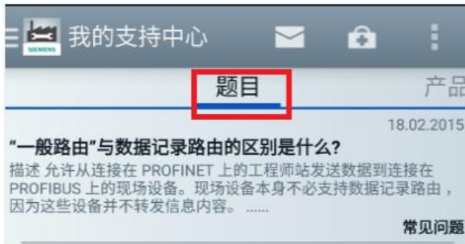
<图 3-2 保存的题目信息>

“我的支持中心”中有三个版块内容：1. 题目（保存已浏览的手册、常问问题等，如图 3-2）；2. 产品（保存产品的技术信息，如图 3-3）；3. 询问（通过发送电子邮件的方式登记技术问题）。