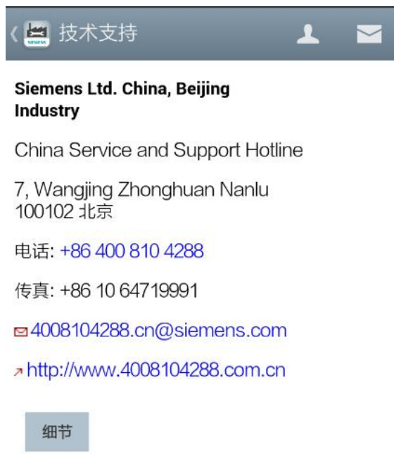
<图 2-11 技术支持联系方式>

屏幕上方选择中国技术支持与服务，进入到图 2-11 部分，可以看到中国区域的西门子技术支持与服务的具体联系方式。