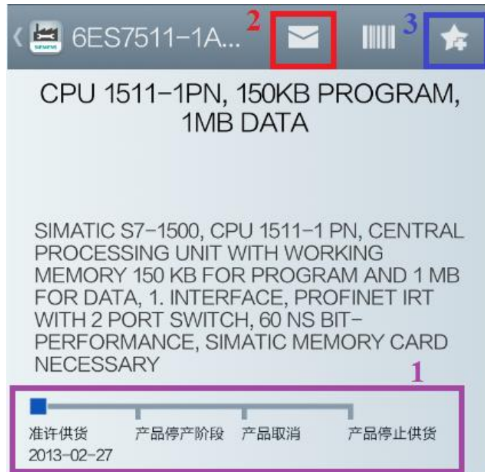
<图 2-5 产品信息 3>

图 2-5 所显示的内容与西门子全球技术资源库是相关联的，会做及时的更新。其中，1 号对话框代表产品的生命周期，可以清楚地了解到该产品是否处于供货状态；2 号对话框表示此页面的产品信息可以通过电子邮件的方式发送；3 号对话框表示该条目信息可以添加到个人收藏中，以便日后查看。图 2-6 显示的是与该产品相关连的参考文档、证书、软件应用工具及图像数据等内容，可以根据需要进行浏览与下载。