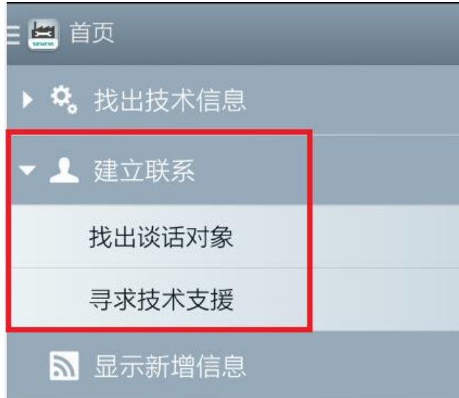
<图 2-9 建立联系功能界面>

如图 2-9 所示。“建立联系”的主要功能是为了方便客户可以通过移动设备随时随地查询到西门子技术支持和销售的联系方式——找出谈话对象，以及通过邮件的方式登记技术问题——寻求技术支援。