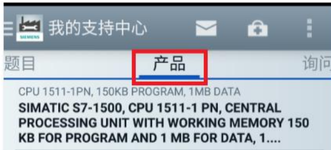
<图 3-3 保存的产品信息>