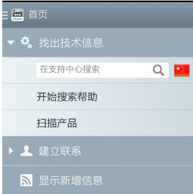
<图 2-1 首页界面>

打开工业支持图标，直接进入首页内容。首页包括三大项内容：“找出技术信息”、“建立联系”及“显示新增信息”。如图 2-1 所示。