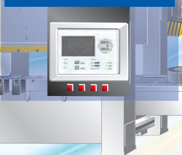
案例 1 高性能人机界面