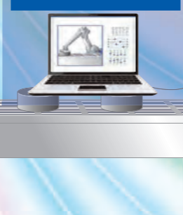
案例 3 维护PC