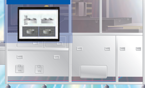
案例 2 应用程序PC