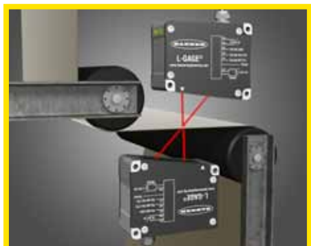
4. 纸带颤动器纸张厚度测量